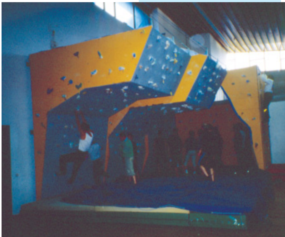
Una fase di "didattica dell'allenamento" del 1° Corso regionale per IAL, in palestra indoor al palasport di Belluno.

tutti ... Augusto) hanno continuato l'opera ... e adesso abbiamo 19 nuovi istruttori con la "patacca". Ma che "fadiga"! Ops ... A proposito ... stiamo parlando del primo corso regionale I.A.L.